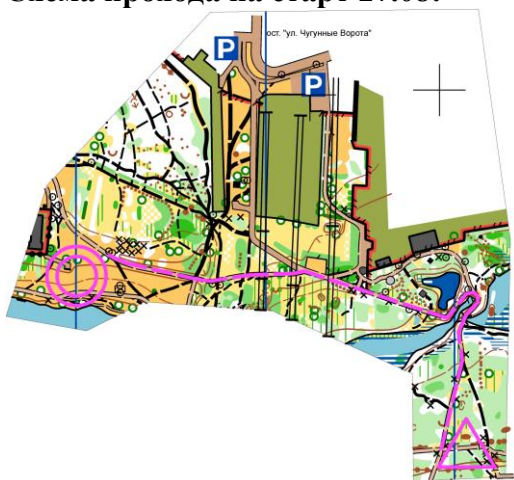
Схема прохода на старт 27.08: