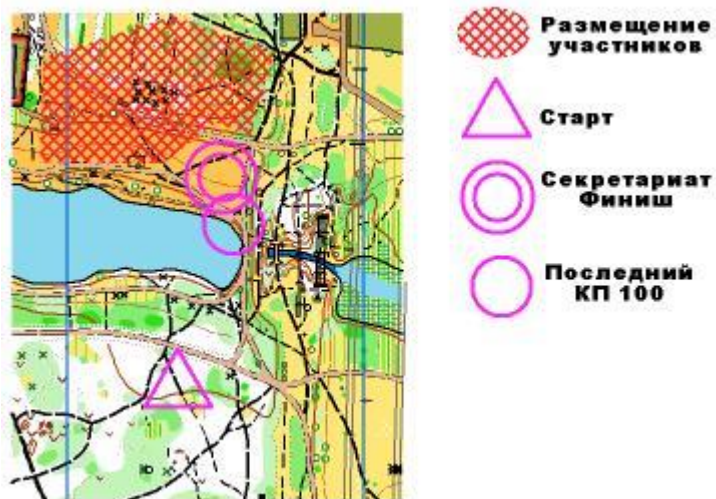
Схема центра соревнований:

Проезд: станции метро «Кузьминки», «Выхино», «Юго-Восточная», автобус 569 до остановки «Улица Чурилица». Далее пешком по схеме около 400 метров.